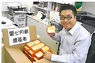
中秋健康月餅贈長者