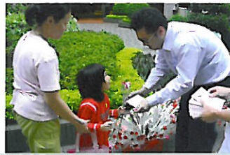
母親節贈送康乃馨