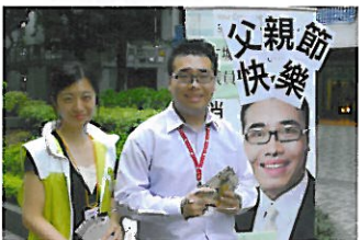
父親節贈送心意卡