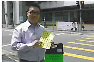
參與賣旗等慈善活動