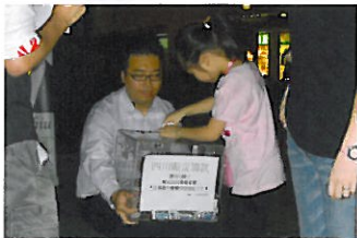
為四川大地震籌款賑災