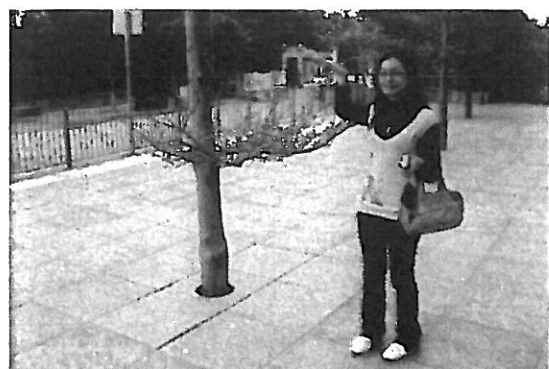
(F) 大樹樹枝極矮，產生危險