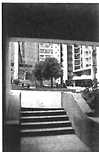
(B) 樓梯級需加防滑沙