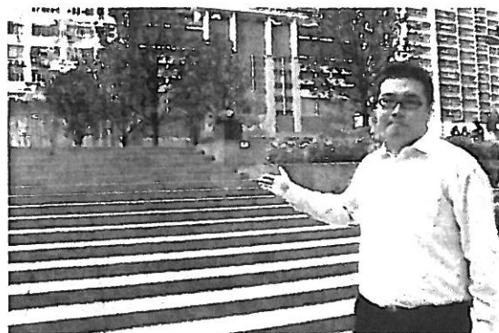
(D) 樓梯兩旁沒有扶手，對長者不便