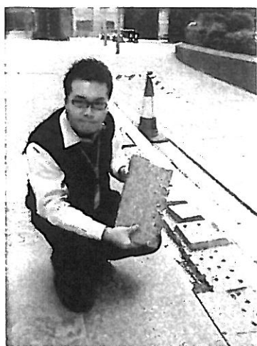
(A) 石磚底部沒有鋼板